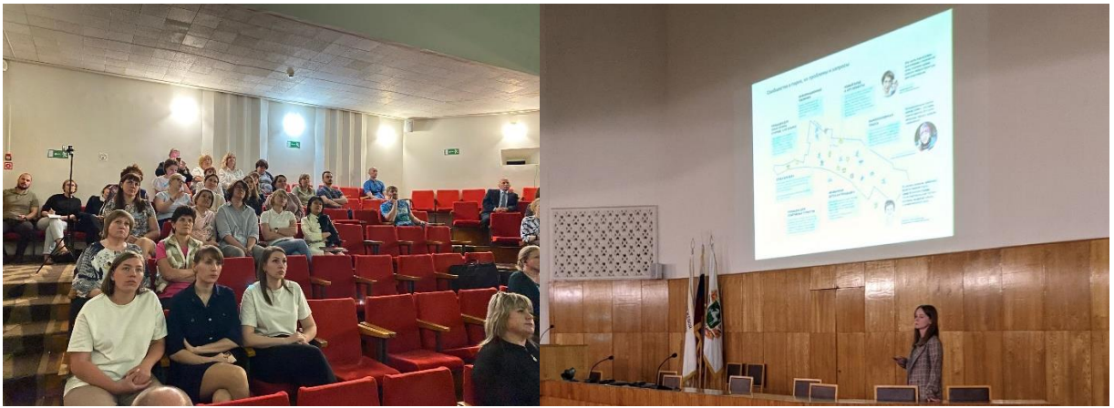
Рисунок 1 – Офлайн презентация итоговых решений в г. Стрежевой