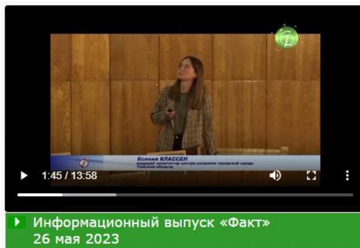
Рисунок 4 – Освещение презентации в СМИ городского округа Стрежевой