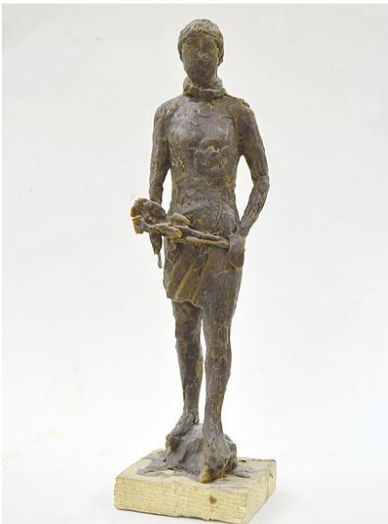
Рисунок 1 – Эскиз памятника Асеньке, победивший в конкурсе в 2013 году