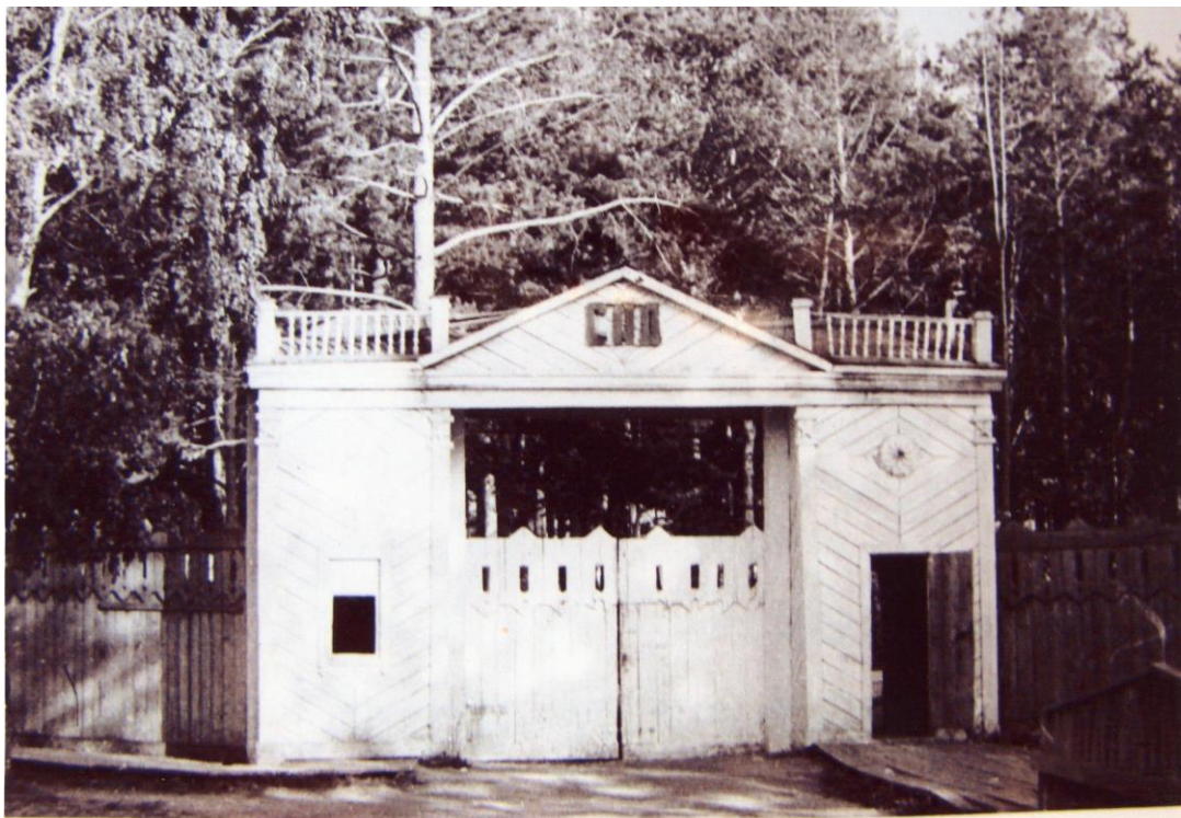
Рисунок 2 – Главный вход в Городской сад в советское время

На севере от Городского сада находится частный сектор. Образ жизни жителей здесь имеет сельские черты – часто нет центрального отопления, а потому жителям приходится топить печи. Даже во время мероприятий по соучаствующему проектированию, которые проводились зимой, часть жителей уходило раньше, не дождавшись результатов, аргументируя это тем, что нужно идти топить печь. Доступ к канализации и водопроводу до дома также здесь есть не у всех – он есть лишь примерно у 70% домохозяйств.